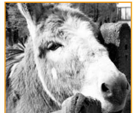
Esel „Casper“ wartet auf Unterhaltung vonseiten der Kinder

sich die Tiere jederzeit zurückziehen und sich ihre Auszeit nehmen. Das Gleiche gilt auch für alle Klienten, die aus unterschiedlichen Gründen zu Besuch kommen: „Ich habe hier einen entwicklungsverzögerten Jungen, der schon in der dreizigsten Woche zur Welt kam. Gemeinsam mit meiner Stute Mia haben wir nehmen anderen Therapien dazu beigetragen, dass er seinen Körper spürt und ein Körperbewusstsein entwickelt. Grundsätzlich ist eine Förderung auf der taktilen, visuellen und auditiven Ebene möglich, indem die Tiere ganzheitlich wahrgenommen werden. Kinder mit sozial - emotionalen Problemen haben auf der Eselsbrücke die Möglichkeit, ohne Leistungsdruck Sozialverhalten zu erlernen, Verantwortung zu übernehmen und Selbstwertgefühl zu entwickeln. Ein achtjähriges Mädchen kam im letzten Jahr zu mir auf den Hof, da sie als nicht mehr beschulbar galt. Sie zeigte totale Verweigerung, war auch nicht von der Mutter zum täglichen Schulbesuch zu bewegen. Immer wiederkehrende Wutausbrüche erschwerten ihr den Umgang mit ihren Mitschülern und ihrer Lehrerin.