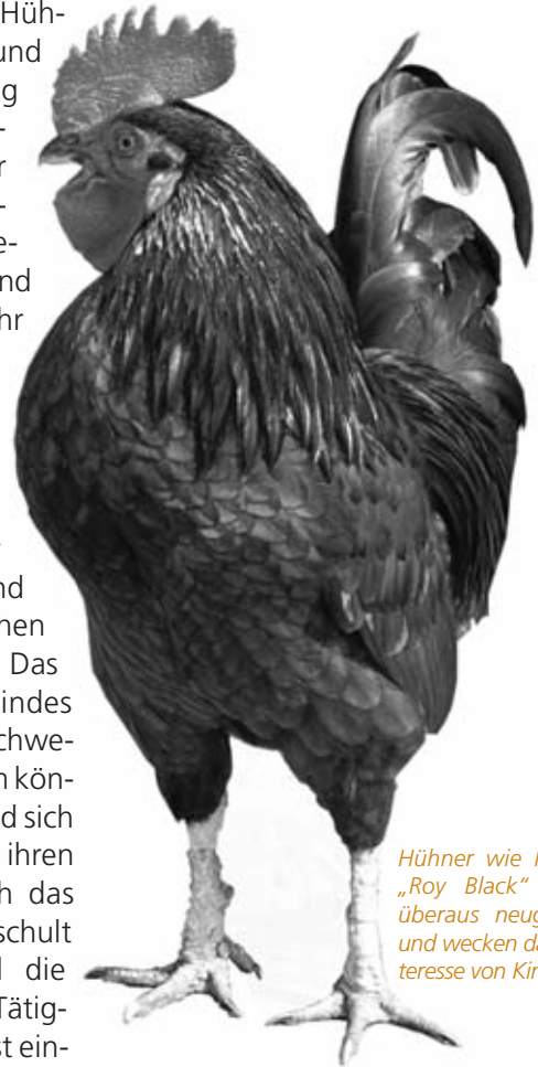
Hühner wie Hahn „Roy Black“ sind überaus neugierig und wecken das Interesse von Kindern

gen Besuchen bei der Versorgung der Tiere auch Kontakt zu anderen Kindern. Sie muss hier unbewusst