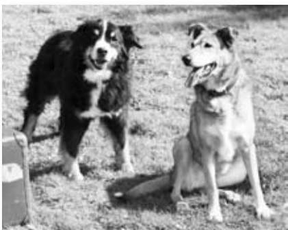
Sam und Lisa haben ihren Koffer schon

Zwei Rentnerfreunde unter sich. Seit Weihnachten warten das ungleiche Freigängerpärchen auf ein ruhiges Zuhause. Leider ist Picco mit seinen 14 Jahren anfänglich etwas scheu, so dass die Kamera ihn auch nicht erwischen konnte. Mit etwas Geduld und der Mithilfe seines Kumpanen Louis steht der Eingewöhnung in einem neuen Zuhause aber nichts im Wege. Der schwarz-weiße Louis ist der Tonangeber unter den Beiden und vermittelt schnell: Wer uns eine Chance gibt, hat einfach mehr vom Leben! Die Beiden würden sich in einem Freigängerhaushalt mit älteren Kindern sehr wohl fühlen.