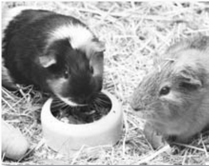
Tracy und Brauni träumen vom Altersruhesitz

„Oldies but Goldies!“ heißt es diesmal bei den Tieren, die über unser Magazin ein Zuhause suchen! Die Aufmerksamkeit soll bei den älteren, aber umso liebenswerteren Schützlingen, unseres Tierheims liegen. Unsere Erfahrung zeigt, dass gerade ältere Tiere nach einer Vermittlung noch einmal richtig aufblühen und quasi „dankbar“ für eine zweite oder dritte Chance in ihrem Leben sind. Der Vorteil bei älteren Tieren: Fast alle Eigenschaften und Wehwehchen sind bekannt, sie sind oftmals ruhiger und ausgeglichener als die jungen Wilden. Fassen Sie sich also ein Herz für unsere Rentnerpärchen!