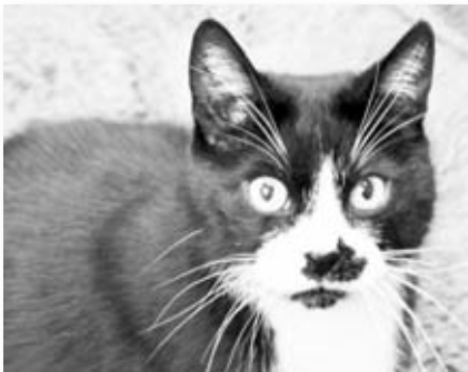
Louis will mit Oldiefreund in ein neues Zuhause

Mit ihren 8 Jahren sind auch Tracy und Brauni noch im Tierheim gelandet. Ihr Besitzer wanderte aus und konnte das Gespann nicht mit in seine neue Heimat nehmen. Seit März warten sie nun auf ein neues ruhiges Zuhause mit viel Freiluftmöglichkeit. Brauni hat leider altersbedingt einen Tumor, so dass die Zeit für die Beiden zu einer neuen Vermittlung drängt.