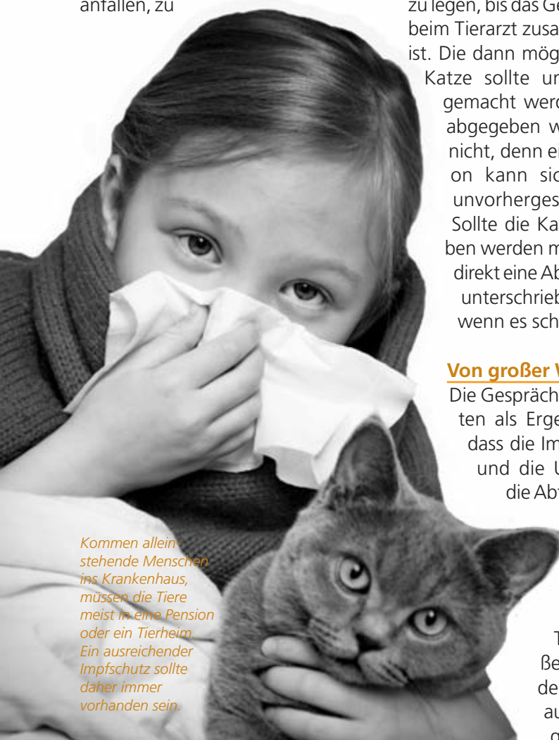
Kommen allein stehende Menschen ins Krankenhaus, müssen die Tiere meist in eine Pension oder ein Tierheim. Ein ausreichender Impfschutz sollte daher immer vorhanden sein.

Ansparen von Geld bei sowieso schon äußerst knapp bemessenem Taschengeld bezieht sich nicht nur auf die in der Wichtigkeitsskala an erster Stelle stehende notwendige Impfung, sondern auch auf die genauso dringliche Kastration der Katzen, da erstaunlich viele Wohnungskatzen – auch Kater – nicht kastriert sind, das für Bezieher von Taschengeld fast unmögliche tierärztliche Behandeln von Krankheiten usw. Aber diese Probleme sollten in einer anderen Gesprächsrunde erörtert werden, denn wesentlich bei dieser ersten Gesprächsrunde war die Sensibilisierung für die wechselseitigen und doch recht unterschiedlichen Standpunkte der Beteiligten. Hier die o.a. Lösungsansätze zu finden und einen Blick „hinter die Kulissen“ des jeweils anderen zu werfen, ist schon ein großer Erfolg. Alle waren sich jedenfalls einig, dass die Gesprächsrunde fortgesetzt werden sollte.