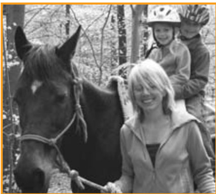
Hoch zu Ross schult Körper- und Selbstbewusstsein

Die Tiertherapeutin und ihre Kollegen und Kolleginnen haben fast ausschließlich positive Erfahrungen mit ihrer Tätigkeit gemacht. Gerade Kinder, die keinen Selbstschutz besitzen, können mit Hilfe der Tiere ihre eigenen Grenzen kennen lernen und