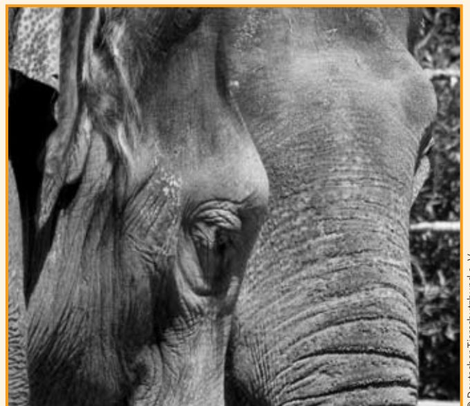
Eingepferchte Rüsseltiere in Tierparks und Zoos