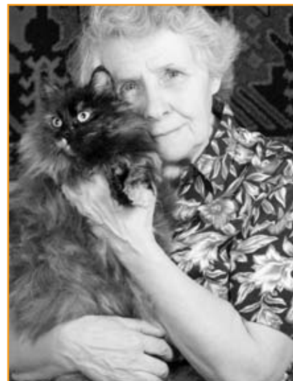
Der Umzug in ein Heim oder betreutes Wohnen ist häufig die Trennung vom geliebten Haustier

Dann gibt es allerdings auch keine Probleme, wenn die Katzen geimpft sind, ein rechtzeitiger Anruf erfolgt und die Abtretungserklärung direkt mit vorgelegt oder im Tierheim unterschrieben wird. Die oben angesprochenen Probleme konnten nur oberflächlich gestreift werden, denn das