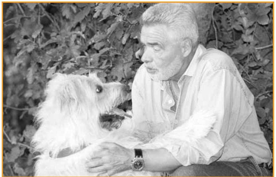
Auch im Urlaub soll es dem Haustier gut gehen. Daher ist eine rechtzeitige Planung wichtig.

sion muss Wert auf einen gültigen Impfschutz zum Wohle aller Pensionstiere legen. Daher sprechen Sie das Thema Impfungen und Erkrankungen